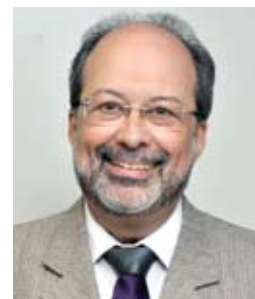
Assessoria de Imprensa SPSP