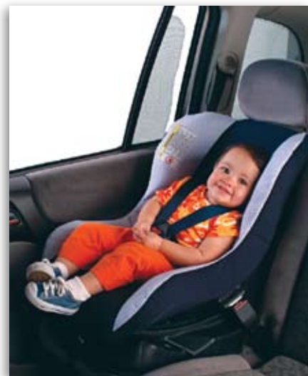
Imagem do Guia da Cadeirinha da ONG Criança Segura