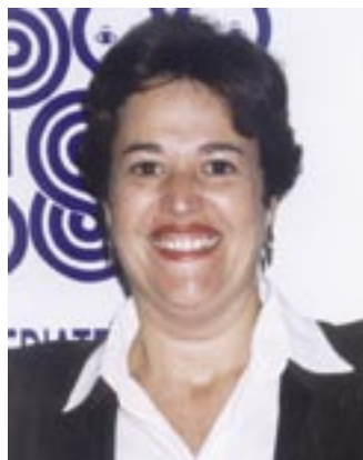
LÍlian: atualizar o pediatra em relação aos exames ultrassonográficos mais adequados.

Durante a manhã haverá uma parte teórica na qual será abordada a ultrassonografia para investigação de patologias de sistema nervoso central, abdominal, rins e vias urinárias,