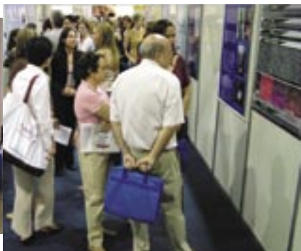
Primeira foto à esquerda: participantes registrando sua presença no evento. Segunda à esquerda: visita aos pôsteres. À direita: equipe do Departamento de Aleitamento Materno na sala especialmente preparada para atendimento ao público no Congresso.