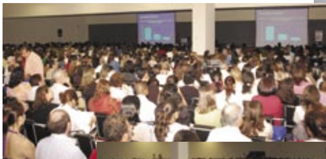
As fotos acima e à direita mostram diversos momentos do Congresso, sempre com salas lotadas e grande movimentação de pessoas.