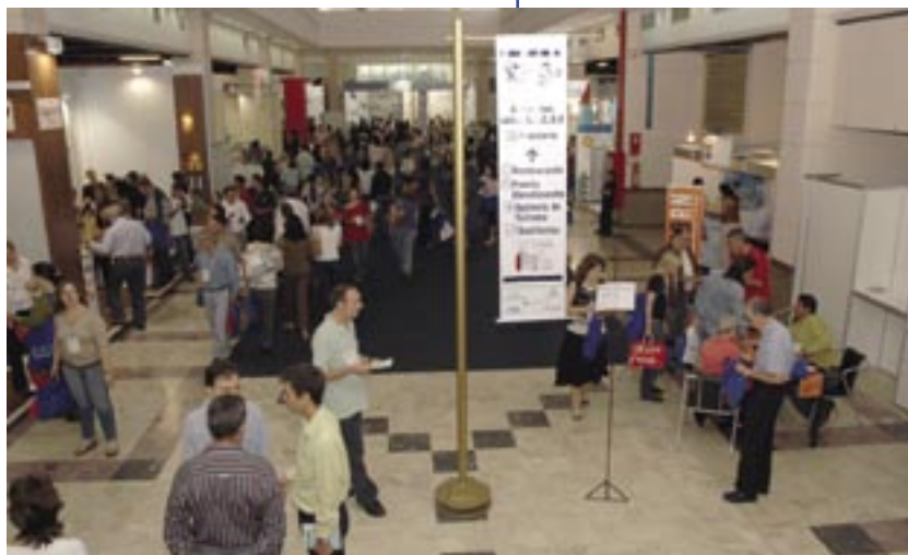
Acima, momento do 11º Congresso Paulista de Pediatria, realizado no ITM Expo, em São Paulo.