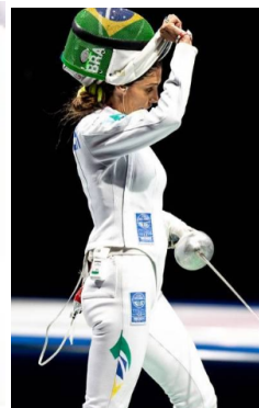
Quimono caratê Short muay thai/kickboxing Calça capoeira (abadá) Esgrima