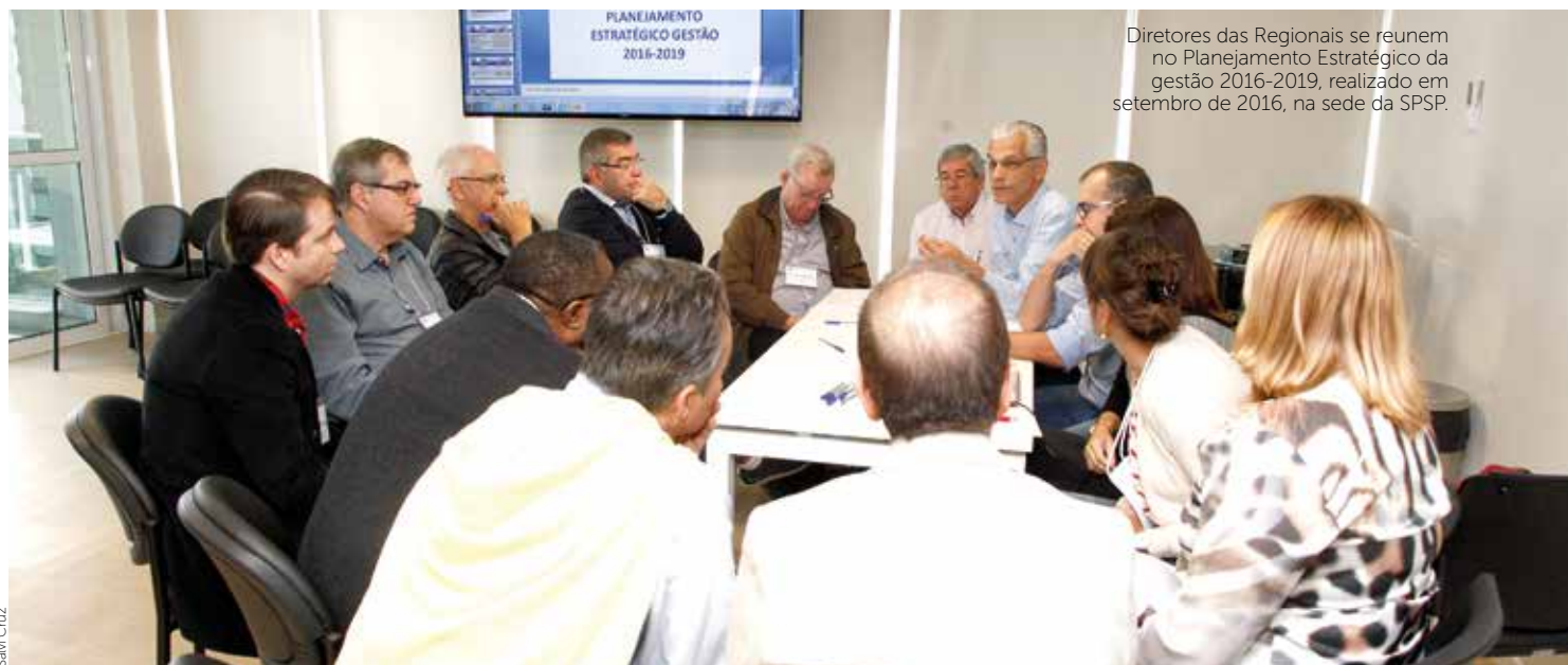
Diretores das Regionais se reúnem no Planejamento Estratégico da gestão 2016-2019, realizado em setembro de 2016, na sede da SPSP.