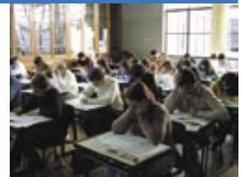
Candidatos ao TEP prestam exame em 2005.

comprovante de Especialização em Pediatria, realizada em território brasileiro e em instituição brasileira reconhecida pelo MEC, com carga horária mínima de 1.800 horas; apresentar declaração emitida por dois sócios quites da SBP ou pelo presidente de uma das filiais da SBP constando que o candidato vem exercendo exclusivamente a Pediatria nos últimos dez anos;