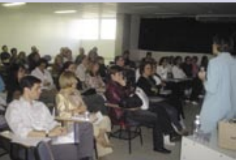
Acima, foto do VIII Congresso de Pediatria do Grande ABC, realizado em agosto de 2006.