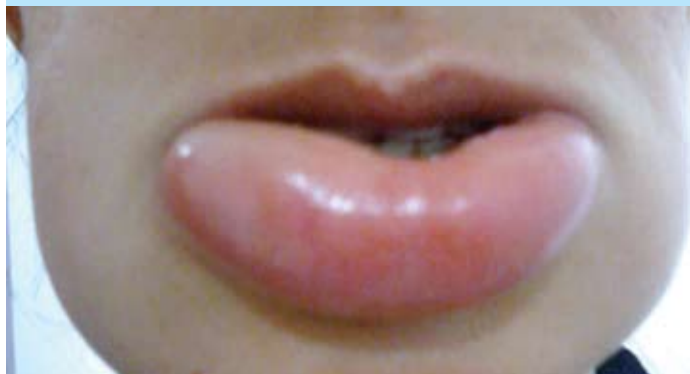
Figura 1 - Edema de lábio em paciente com AEH

Em decorrência das complicações graves que podem ocorrer nos pacientes com AEH, a profilaxia das crises deve ser estabelecida. Há dois grupos de medicamentos: os andrógenos atenuados e os inibidores da plasmina. Dentre os andrógenos, o danazol encontra-se incluído nos medicamentos de alto custo e o